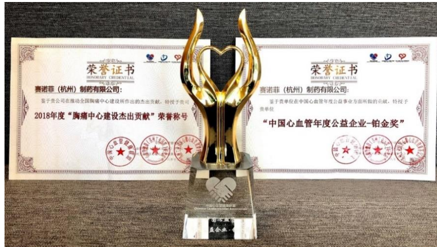
赛诺菲连续五年荣获“胸痛中心建设杰出贡献奖”

为了延伸项目影响力，2020年6月起，赛诺菲在持续推进县域胸痛中心建设的基础上，开始扩大覆盖范围，同步赋能大医院的胸痛中心建设。2021年，项目预计助力120家已通过胸痛中心认证的大医院达到胸痛中心再认证的建设和质控要求，同时推动胸痛救治单元建设，完善区域协调救治体系。未来，赛诺菲还将开发包含大医院、县医院以及社区医院的胸痛中心一体化建设，为胸痛患者搭建救治区域一体化的“高速路”。